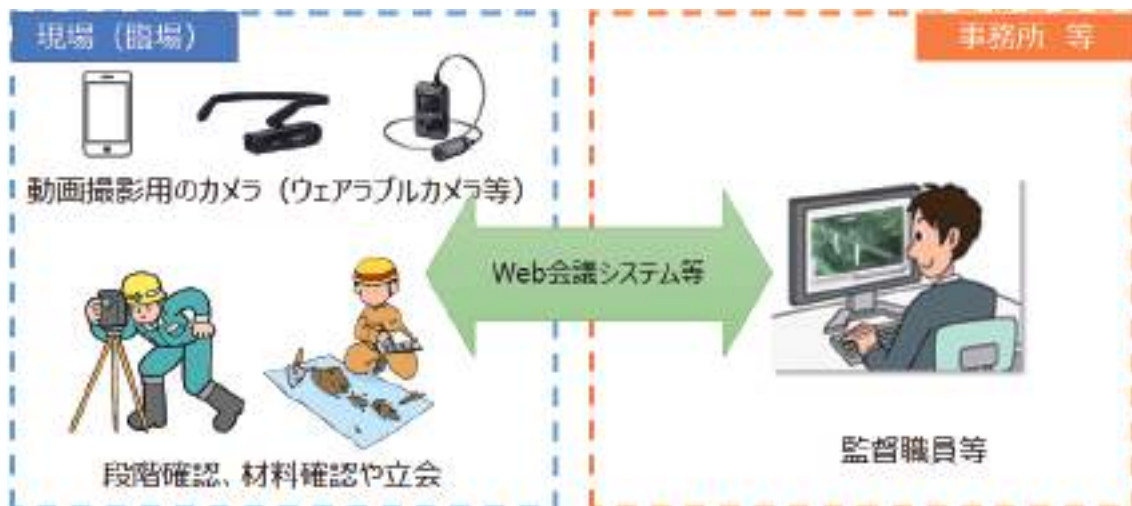
図 3-1 機器構成（例）

なお、発注者側にて準備している動画撮影用のカメラ（ウェアラブルカメラ等）や既に使用している Web 会議システム等がある場合、また特記仕様書等に資機材準備の別途記載がある場合にはこの限りではない。