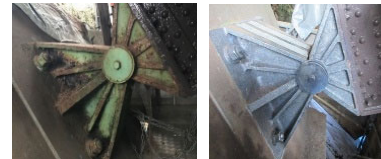
従来技術では施工困難だった部位のレーザー照射による処理例