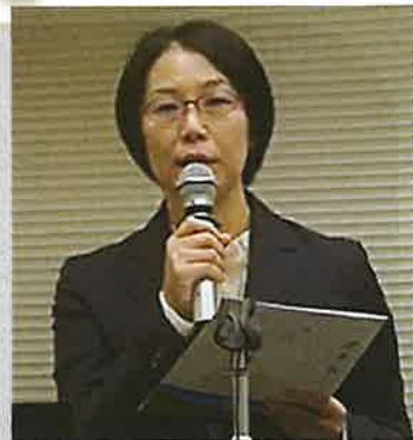
官民ジョブサイト 担当者

実は近年の人材市場の変化は顕著だと感じていますね。人事担当の方に「45歳以上の中堅・シニア層」と説明すると、以前は年齢だけでNGという反応も珍しくなかったのですが、最近では「 専門性や強みを持つ人材なら年齢は問わない 」と言われることが増えてきました。